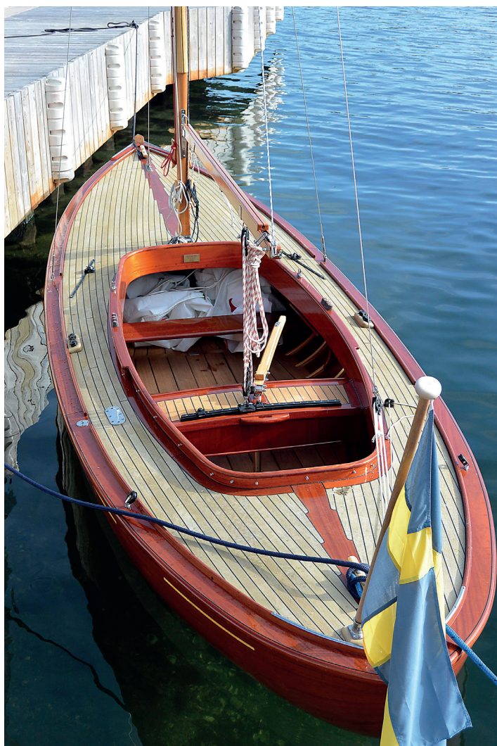
Andunge nummer 99.

behöva 1 500 arbetstimmar för att bli färdig.