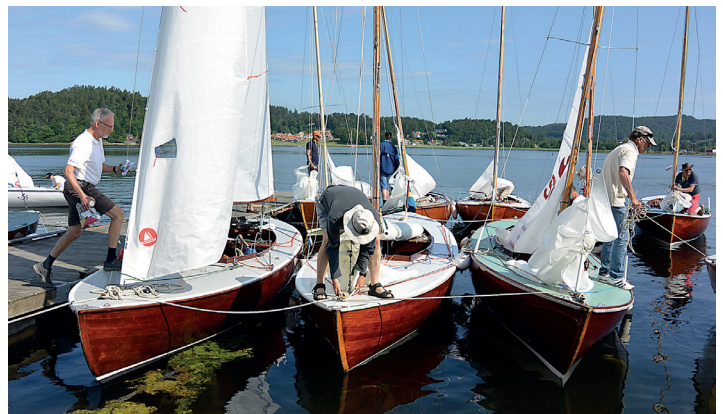
VM i Andunge. Andungeklubben arrangerar varje år ett populärt VM, som ska tolkas som Västkustmästerskapet för Andunge.