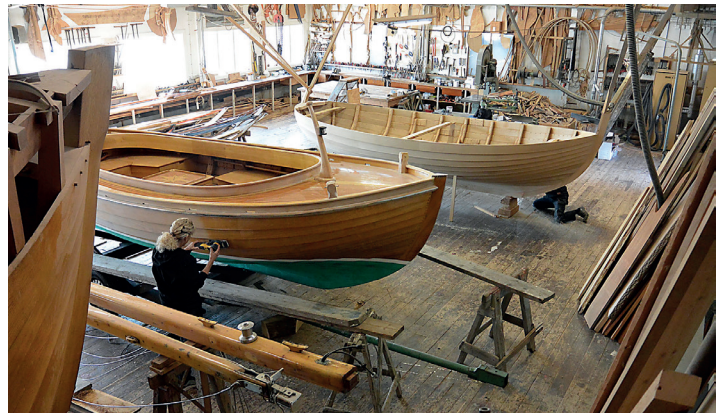
Det är alltid båtar på gång i det lilla varvet.