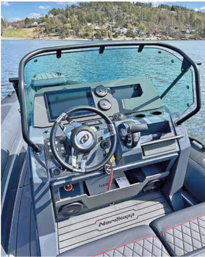
Förarplatsen har rikligt med bra stuvutrymmen och ergonomiska lösningar.