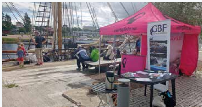
Gästriklands BF passar på att marknadsföra sig tillsammans med Visit Gävle.

– Vi har likartade frågor att arbeta med och nu ska den lämpligaste vägen till sammanläggning diskuteras.