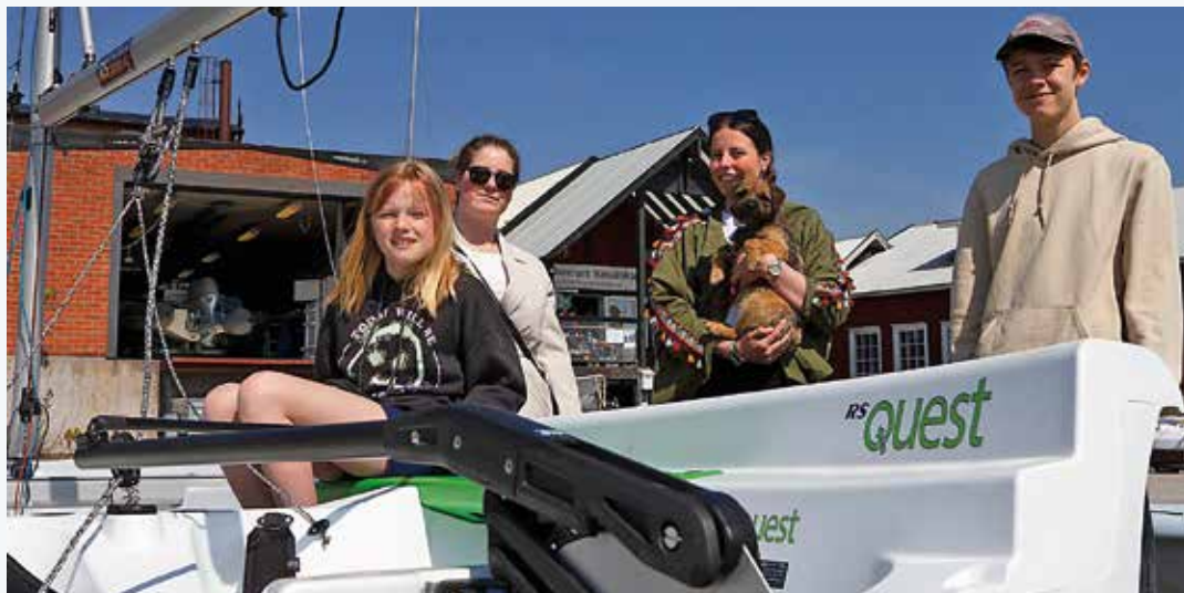
Det blev en lyckad dag för Loftahammars BS på Båtklubbens dag i Loftahammar 13 maj.

Flera nya medlemskap tecknades och många ville sponsra klubbens nya brygga med 200 kr per plank. Klubben har fått bidrag till sin nya brygga och de fem Questbåtar som är beställda. Bryggan kommer att byggas av Loftahammars Varv och Marina. Sparbankstiftelsen Tjustbanken, Länsförsäkringar, Sisu Småland