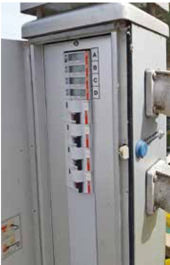
Laddstolpe med elmätare i varje uttag på Ekhagens Båtklubb.