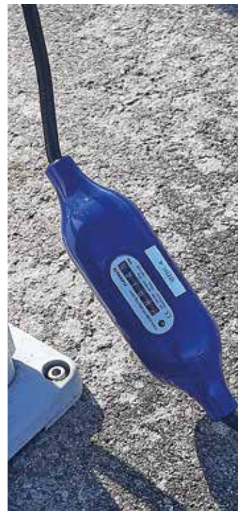
Blynäsvikens BK använder flyttbar elmätare av märket Flexmate.

Vad finns det för tekniska lösningar för att mäta förbrukningen?