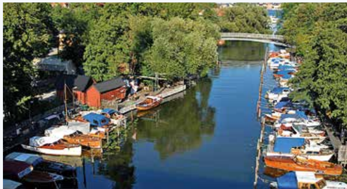
Heleneborgs Båtklubb i Pålsundet i Stockholm.