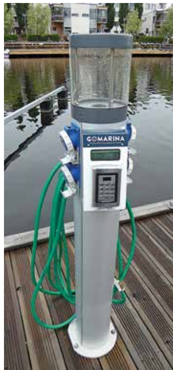
I Gävle gästhamn kan man betala via en app.

i den ordinarie avgiften och vad som var och en själv får betala verkar klubbarna i stort ha samma grundsyn, även om det kan skilja i detaljerna. Det är heller inte alla klubbar som behöver dela upp kostnaderna. Har man en