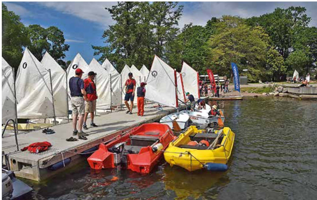
Sjöhistoriska har ett stort antal egna seglingsjollar som användas av seglarskolan.

Sommaren 2020 var speciell även för den här seglarskolan. Antalet veckor utökades från ordinarie sex till åtta veckor på grund av att många ville vara med och museet fick även