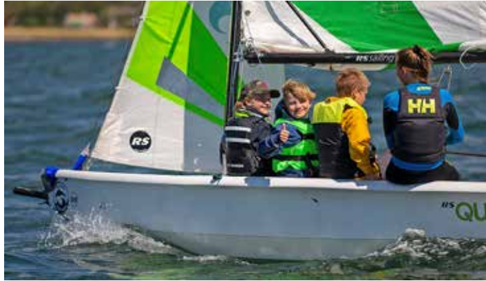
Unga seglare på SS Delfinens seglarskola i Vejbystrand sommaren 2021.

– Vi erbjuder utbildning i jolle, kölbåt, vindsurfing och kite. Vi har en väl utvecklad kursplan