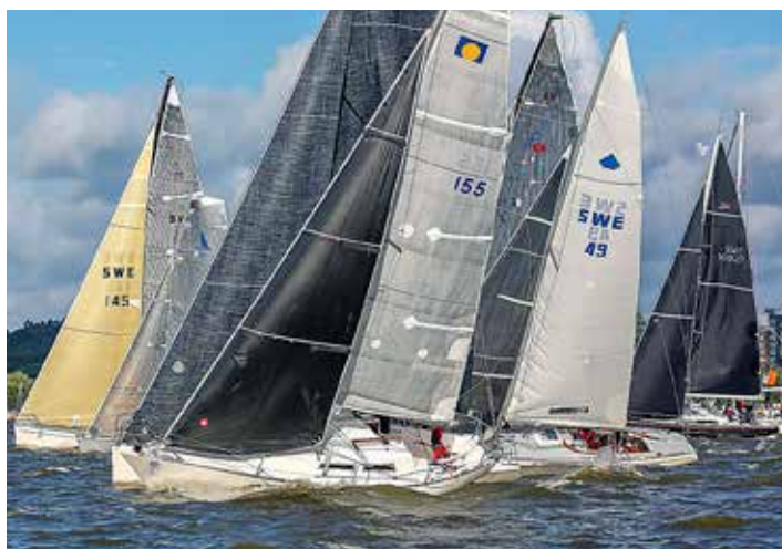
Alla kappseglingar börjar i Sailarena.

ALLT FLER KLUBBAR använder Sailarena som ett skyltfönster för sitt evenemang och som ett sätt att kommunicera med deltagarna. Där finns oftast inbjudan, anmälningsfunktion och många gånger också anslags-