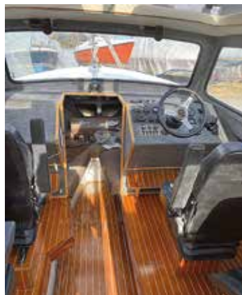
Styrplatsen har flyttats till styrbord sida och hytten har nu fyra dämpade lastbilsstolar för att öka komforten. Alla ytor är klädda med gråfilt.