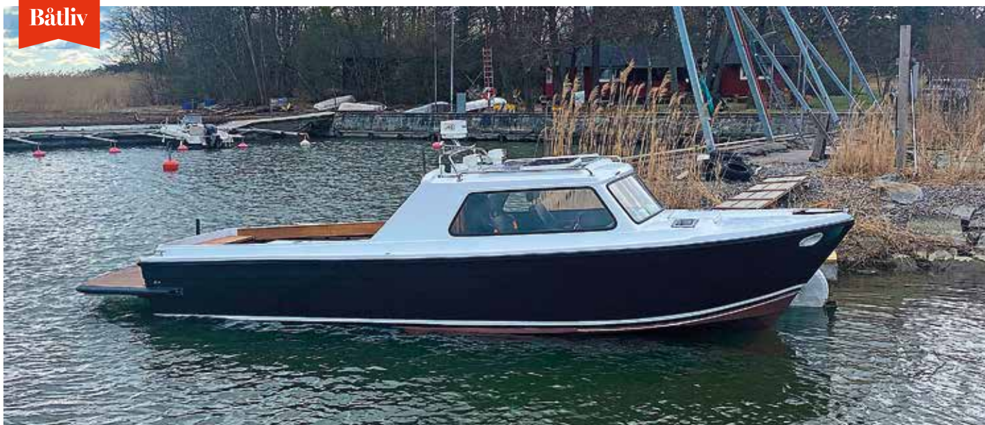
Carl Reuterswärd ville ha en unik båt och valde att bygga om sin Monark 670 rejält. Båten är bland annat förlängd 1,5 m och har fått en kraftfull dieselmotor.