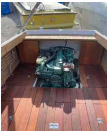
Originalmotorn var en Volvo B18. Idag sitter det en Volvo Penta KAD-44 med 290 DPE-drev i motorrummet.