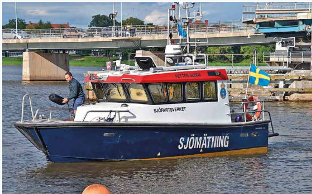
Sjömätning på Röka Strömleden.