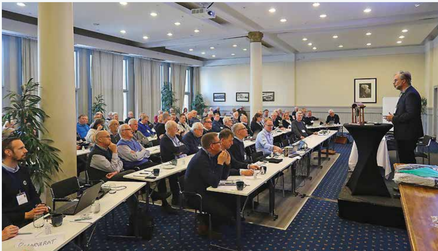
Ett 80-tal delegater från båtförbund i hela landet var samlade till årets Båtriksdag, som hölls i Karlstad.