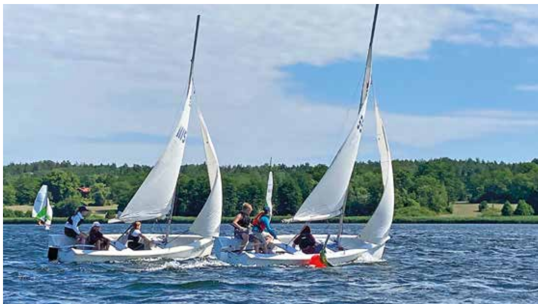
Sollentuna Södra Scoutkårs seglarskola.

Begreppet ”Learning by doing” är en viktig hörnsten inom scouterna, där den centrala delen av lärandet utgörs av att barnen får prova på själva. Inom segling är den pedagogiken