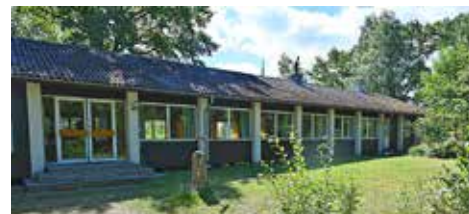
En av båtklubbens fastigheter på Stora Bubbsholmen. Ett av klubbens hus flyttades till Bubbsholmarna från Skutterön en bit längre bort.