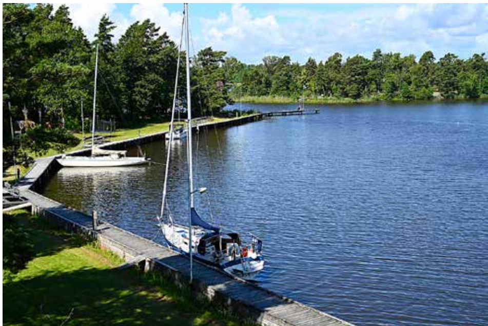
Hamnen på Stora Bubbsholmen är ofta välfylld på sommaren. Dock inte vid Båtlivs besök.