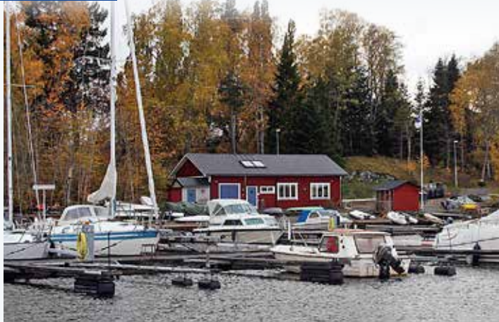
Det verkar som att kommunerna har glömt bort den kommunala nyttan av båtlivet och vad det betyder. Bilden är från Norrtälje Segelsällskap.

Nu verkar det dock som om många kommuner har skiftat fokus. Det har skett och sker massuppsägningar