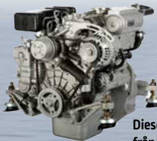
Dieselmotor från 43 700 kr.