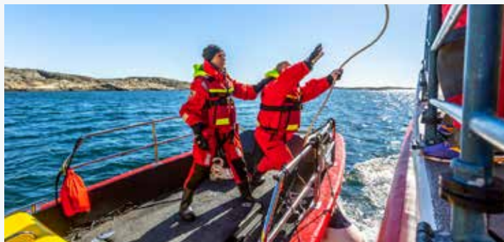
Webinarium om sjöräddning hålls 26 april.