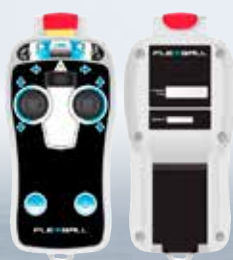
Docking remote från 43 000 kr.

NYHET: Nu finns vi på nätet, med förmånliga priser och snabba leveranser. Vår hemsida har utförlig information om olika produkter och bruksanvisningar finns tillgängliga för nedladdning. Vid ytterligare frågor finns vi på mejl och telefon.