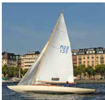
M30 konstruerades 1933 och firar alltså 90 år i år!

komplett byggsats för 3 300 kronor (inklusive nitar, brickor och skruvar). En byggbeskrivning publicerades även i tidningen Till Rors 1947. För den som kunde göra mycket själv, erbjöds även lösa byggdelar och den som ville kunde köpa en helt färdigbyggd båt för 7 500 kr.