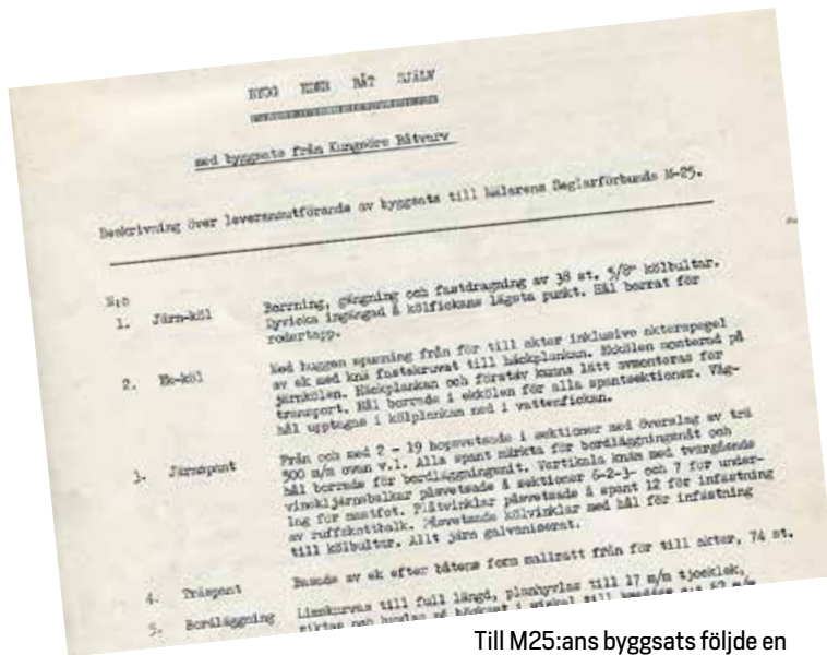
Till M25:ans byggsats följde en mycket utförlig byggbeskrivning.