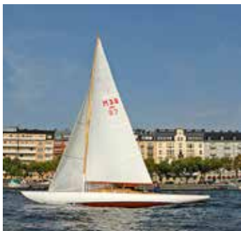
Släktskapet med skärgårdskryssarna är tydligt.