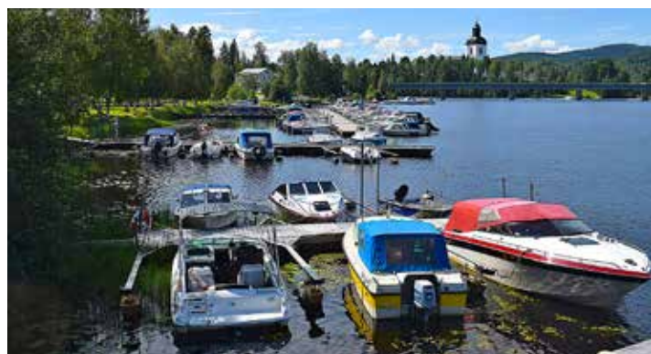
Järvsö båthamn har successivt växt. Idag ryms 62 båtar mellan Y-bommarna.