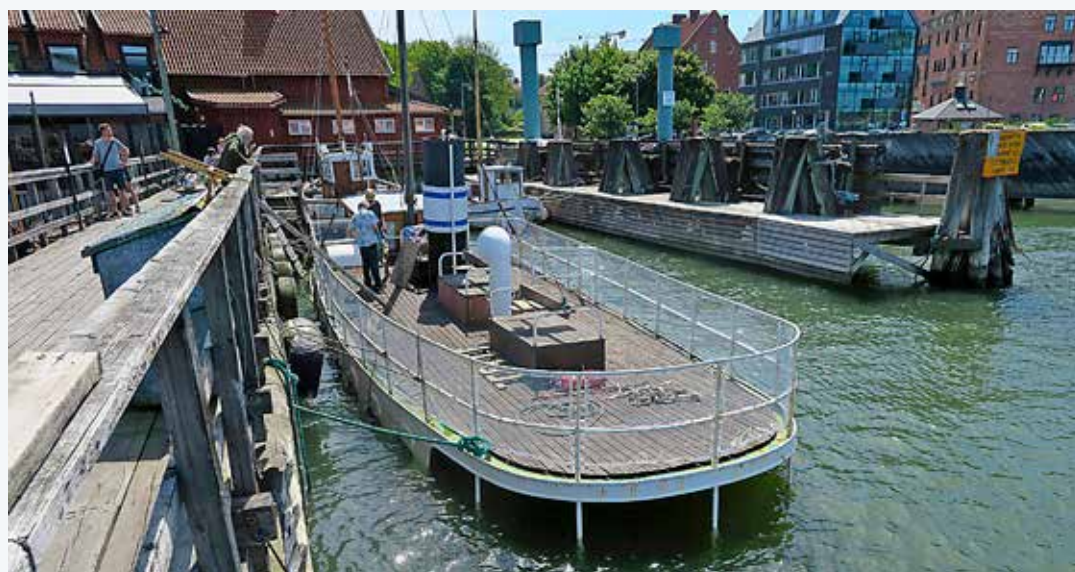
Ångbåten Eduard Melin står stadigt på botten.