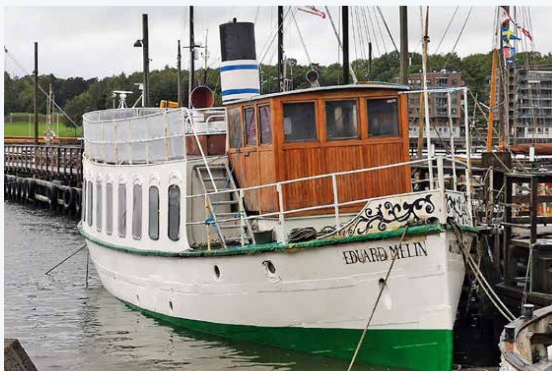
Ångbåten åter i sitt rätta element. Nu återstår en omfattande renovering invändigt.