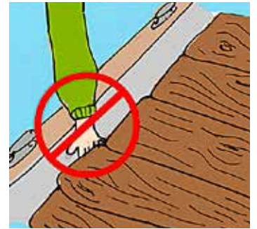
Kroppsdelar är svårare att laga.