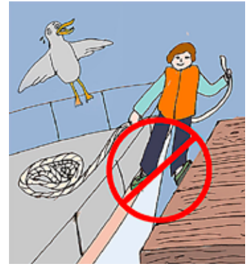
Båtar och kajer går att reparera.