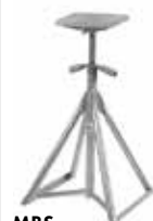
MBS Motorbåtsstötta Top 310x160 mm