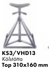
KS3/VHD13 Kölstötta Top 310x160 mm

TOPPLATTA AV STÅL. SKROVSKYDD AV GUMMI GRÅ EPDM. US-2021-0245850-A1