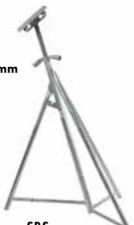
SBS Segelbåtsstötta Top 255x255 mm