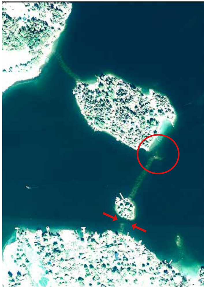
Pukholmen Flygbild från Lantmäteriet visar var man kan passera.