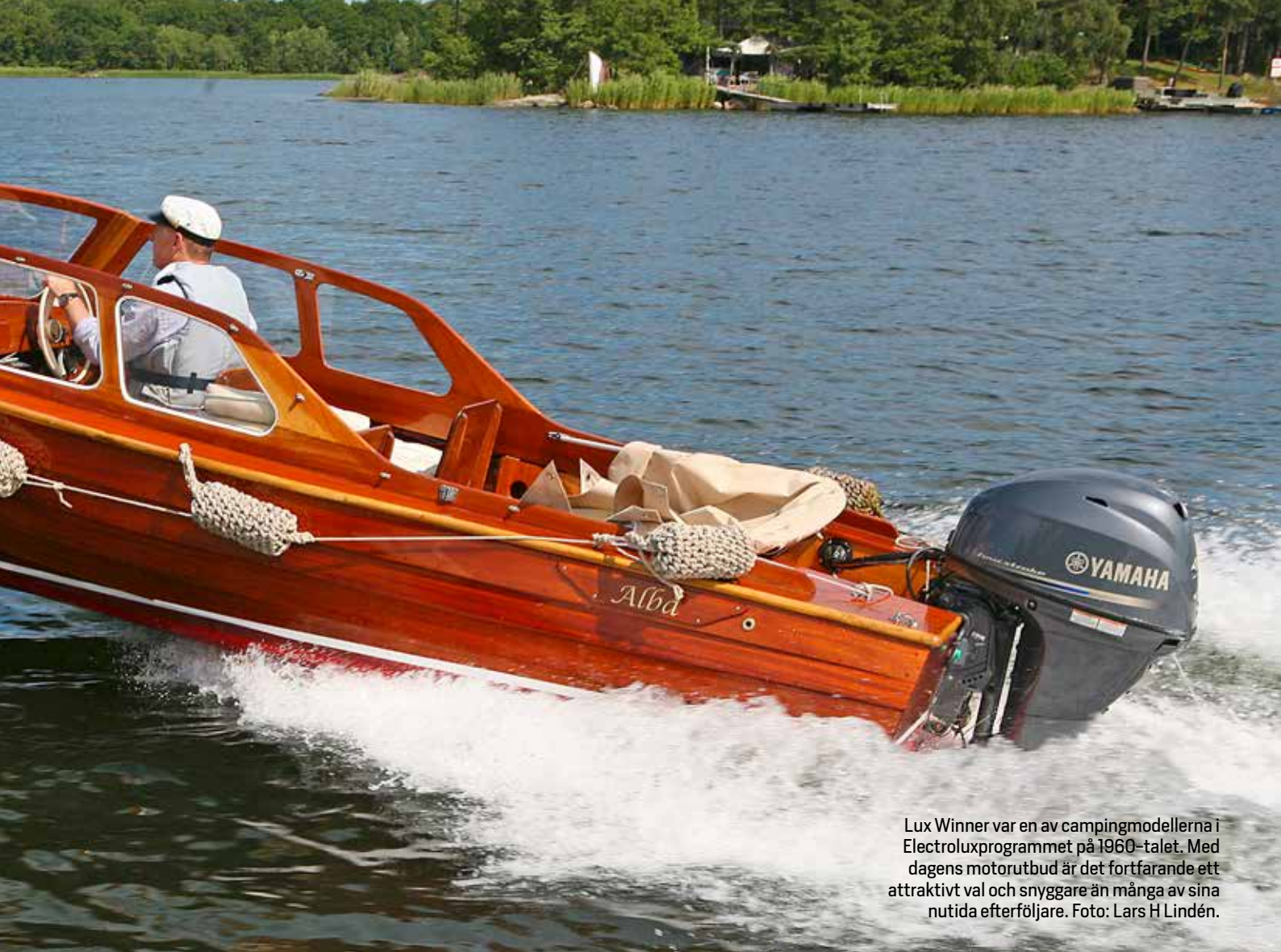
Lux Winner var en av campingmodellerna i Electroluxprogrammet på 1960-talet. Med dagens motorutbud är det fortfarande ett attraktivt val och snyggare än många av sina nutida efterföljare.

sommarens frihet” i tidningen Motor Journalen 1928, recenserades den nya båten i smått entusiastiska ordalag, men med fokus på hastighet, inte övernattnings. Båten gjorde succé som ett billigare alternativ till ruffbåtar, det arrangerades till och med speciella tävlingar för ”Åtvidabergsbåtar” och det exporterades båtar till både Egypten och Sydamerika.