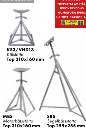
MBS Motorbåtsstötta Top 310x160 mm