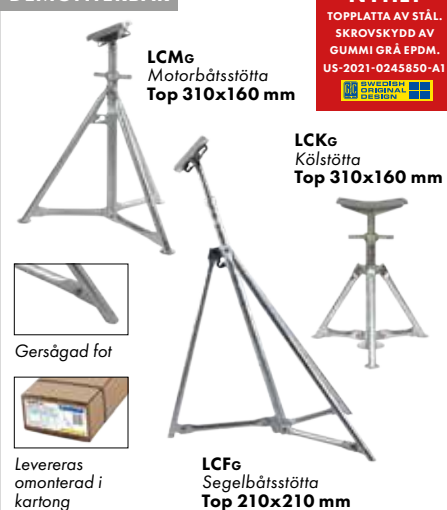
LCMg Motorbåtsstötta Top 310x160 mm