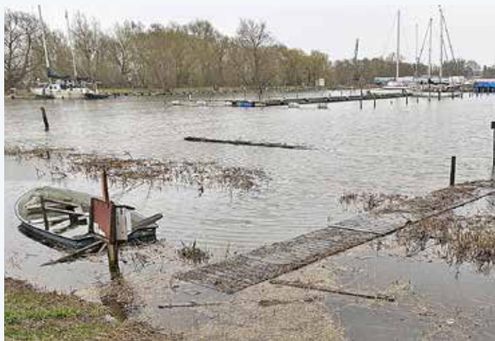
Så här års en välfylld hamnbassäng, som om vädergudar och behov av elproduktion säger annat, kan vara nästan tömd.

Det låga vattenståndet gynnar även den invasiva arten vattenpest, som med sina trådaktiga rötter, meterlånga slingor och täta bestånd, ytterligare försvårar båtlivet. För detta har dock Linköpings segelsällskap fått LOVA bidrag, men bara för några år framåt i taget.