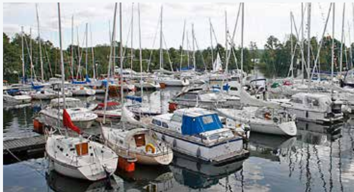
Många båtar skulle kunna användas mer, kanske via en "fadderverksamhet". Bilden är från Ekerö Båtklubb.

I båtklubben efterlyser han en yngre förmåga som vill ha en