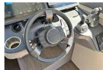
Ratten är smart med knappar och paddlar för funktioner som behöver nås extra snabbt.