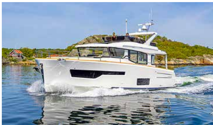
I lagom cruisingfart i skärgården känns Nimbus 495 Flybridge helt rätt. Men båten passar även för långa turer till havs.