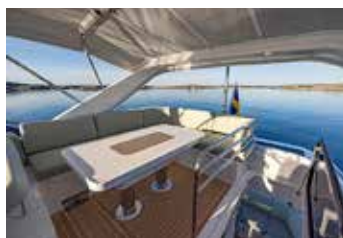
Det aktre utrymme på flybridge. Här finns inget pentry men ett kylfack och en matplats.