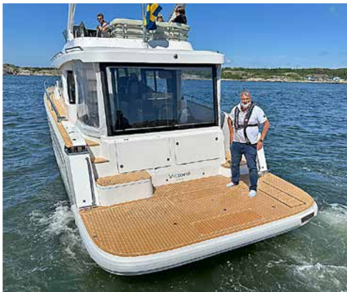
Badbryggan är väl tilltagen och har plats för en jolle eller vattenskoter.