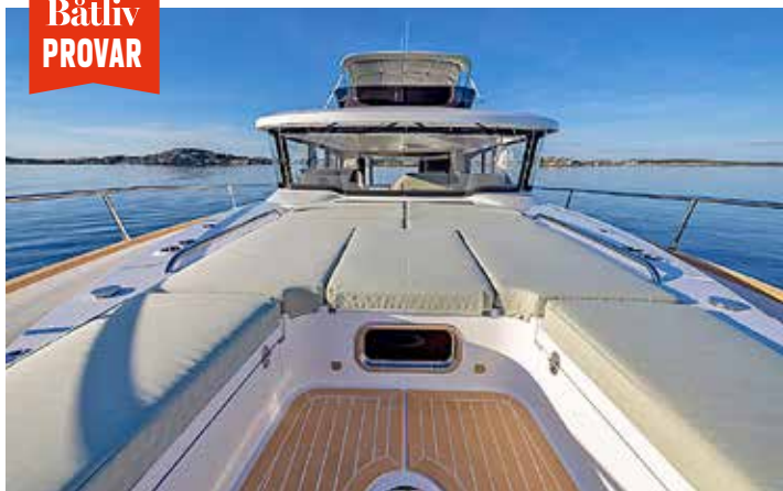
Fördäcket har solbäddar och en sittyta med bord och plats för några personer.