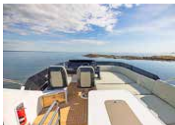
Förarplatsen på flybridge ger bra utsikt över skärgården och mötande båtar.