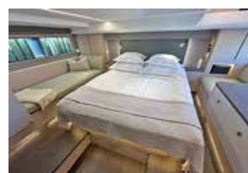
Ågarhytten är placerad midskepps med stora fönster på sidorna och en extra koj om styrbord.