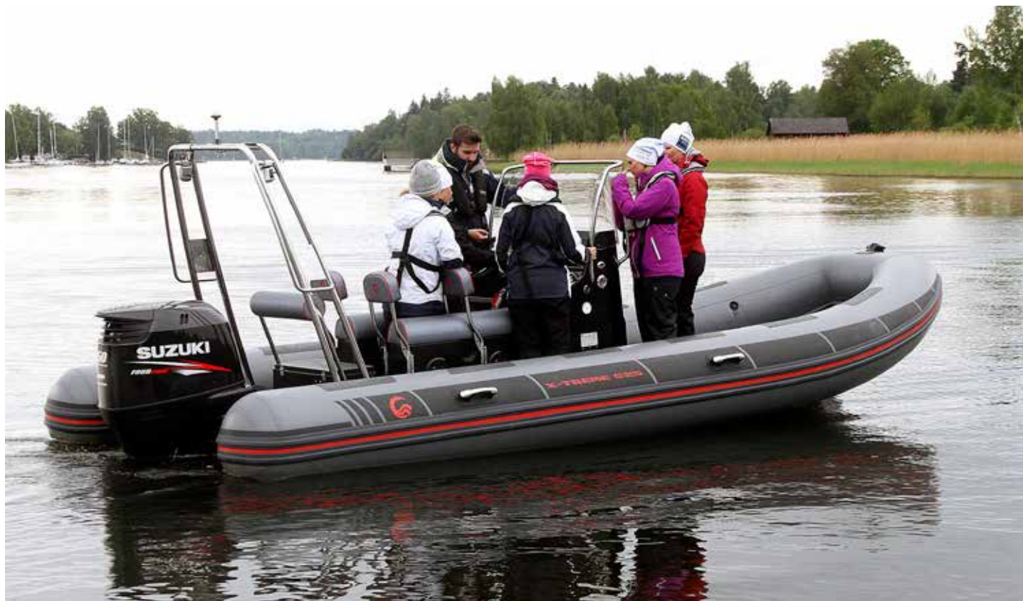
Utbildning med kvinnor som deltagare.

NFB inför nya rutiner för Förarintyg m m: