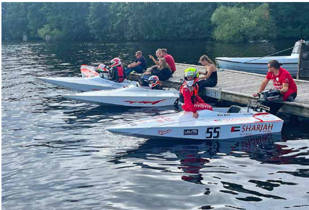
Ordförande Smedjebackens Båtklubb har fått bidrag till att köpa fem GT10.