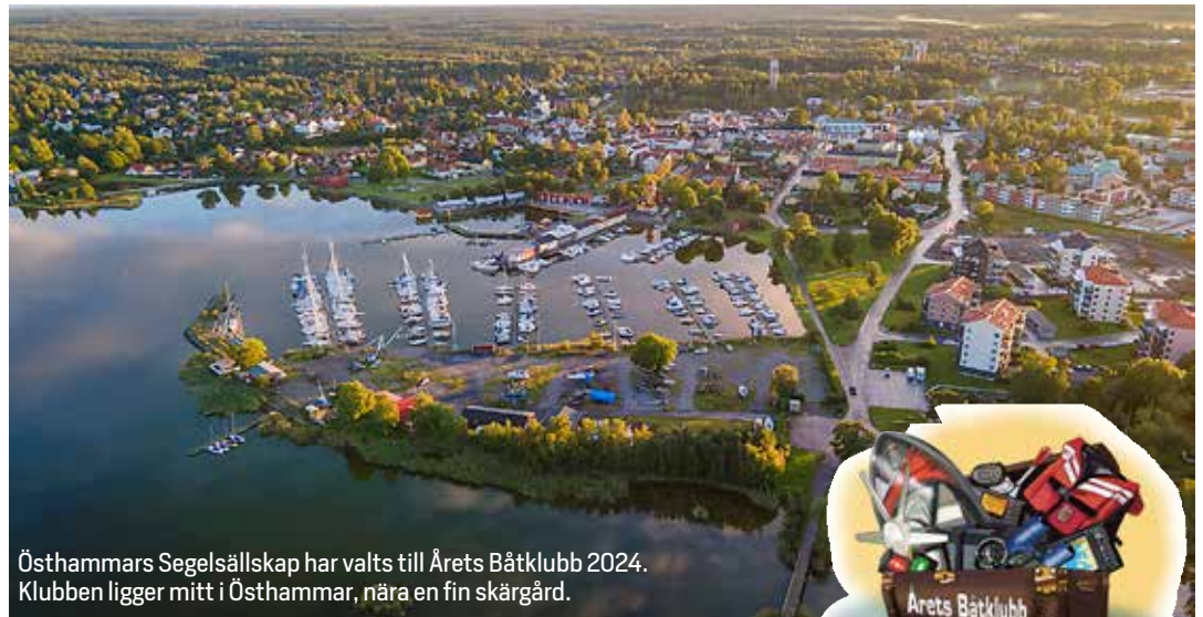
Östhammars Segelsällskap har valts till Årets Båtklubb 2024. Klubben ligger mitt i Östhammar, nära en fin skärgård.