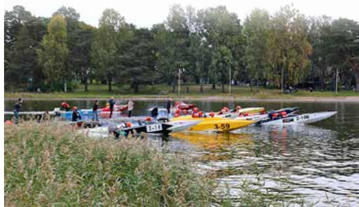
Årets Båtklubb har en omfattande ungdomsverksamhet med både motorbåtar och segelbåtar.

– Vi ligger i skärgården. Det är bara 15 sjömil till Grisslehamn genom en relativt skyddad farled och till Öregrund 20 sjömil. ☺