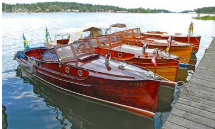
Några CGP-båtar samlade vid en medlemsträff 2007.

För CGP-sällskapet, som fyller 30 år i år, väntar ett jubileumsfirande i augusti. ☺