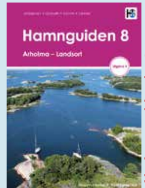
Arholma - Landsort kr 848