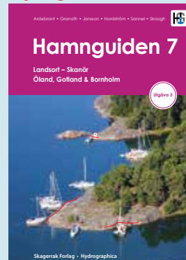
Landsort - Skanör, Öland Gotland & Bornholm kr 848