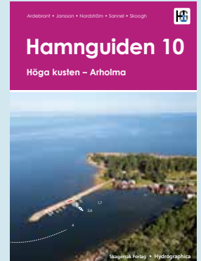
Höga kusten - Arholma kr 748