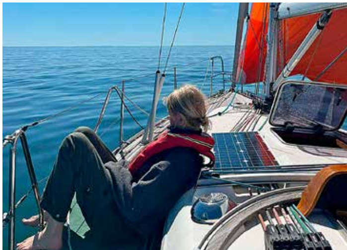
Solsemester? Nej, Gotland Runt!