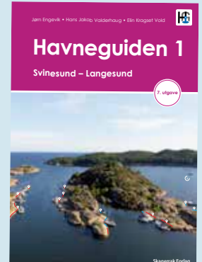
Svinesund - Langesund kr 848