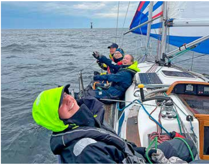
Almagrundet syns långt bort i fjärran.