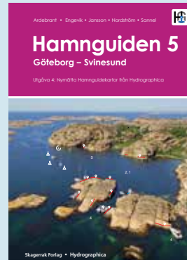
Svinesund - Göteborg kr 848