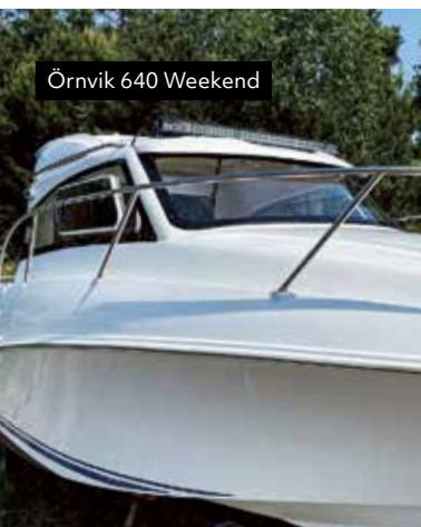
Örnvik 640 Weekend