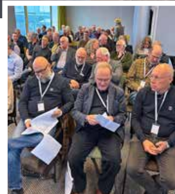
Deltagare på SMBF:s Båtdag och årsmöte.