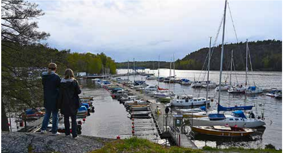
Sätra Båtsällskap är en av SMBF:s 255 medlemsclubbar.

– Orsaken till att vår miljökonferens är