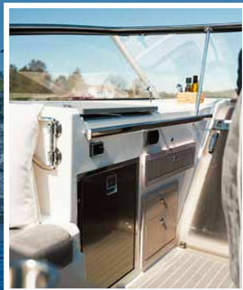
Pentrybänken på babords sida.

IBIZA 811 TOURING har en stor pentrymodul på babords sida mitt emot förarplatsen med gott om avställningsytor på en bänk, kokplatta och en vask. Det finns plats för ett 49 liters