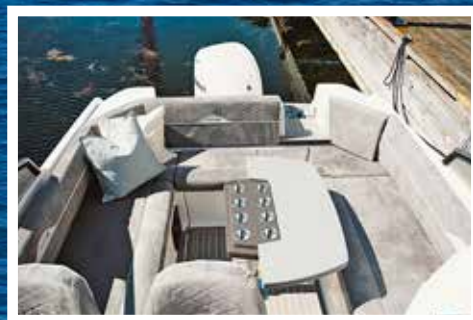
Stor sittbrunn med gott om plats.