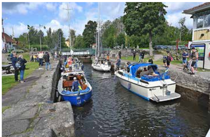
Göta kanal är populärt varje sommar. Bilden är från Forsvik.

Förutom att bokningarna i allmänhet ökar längs Göta kanal visar även siffrorna för båttrafiken en positiv utveckling och ligger omkring tio procent högre än vid samma tidpunkt förra året.