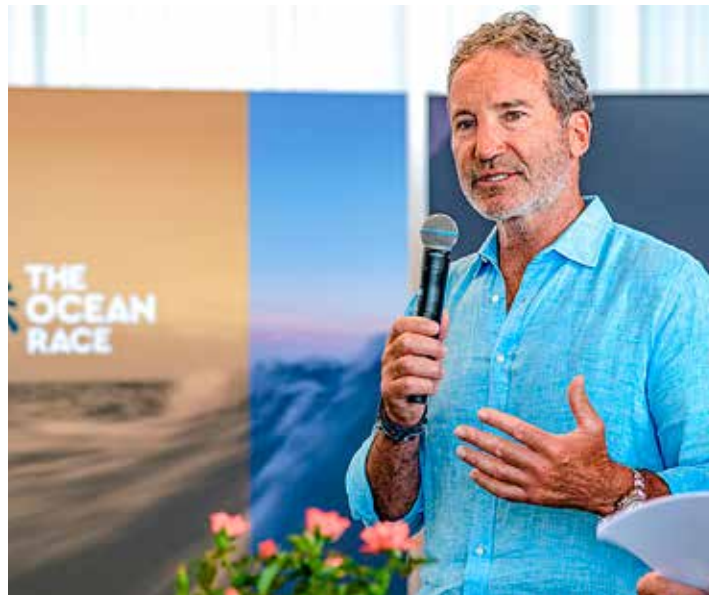
Paul Cayard.

Cayard är kanske ännu mer känd för sina framgångar inom havskappsegling. Under säsongen 1997–98 blev han förste amerikan att som skeppare vinna klassiska Whitbread Round the World Race. Och han gjorde det på svenska EF Language. Några år senare kom han tvåa i Volvo Ocean Race (2005–2006) som skeppare på Pirates of the Carib-