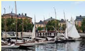
Troligen Hudiksvalls Segelsällskap första regatta 4 augusti 1876. Bilden är färglagd i efterhand.