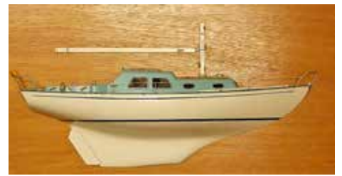
En halvmodell ger en utmärkt bild av den båt vi känner som Fingal.