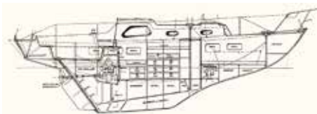
Den första versionen hade bara ett fönster i doghouset och kallades Figaroso.

Att denna båt inte var ett hugskott framgår av antalet ritningar och det intresse Reimers ägnade den under mer än 15 år.